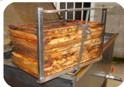
2 paniers 15 cadres pour nettoyage à la soude caustique