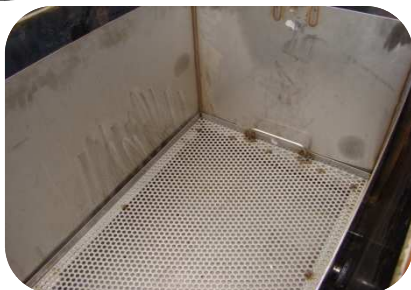
Grille de fond perforée inox amovible pour filtration