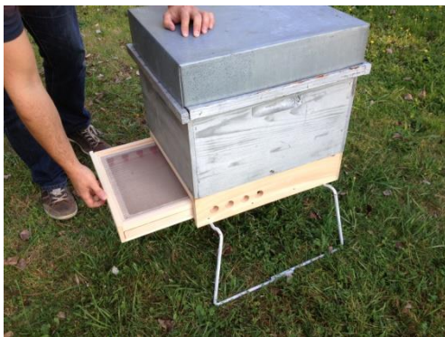
Etape 1 : Ouvrir le tiroir de la trappe par l'arrière de la ruche