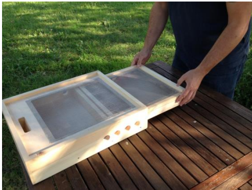
Etape 4 : Refermer le tiroir de la trappe